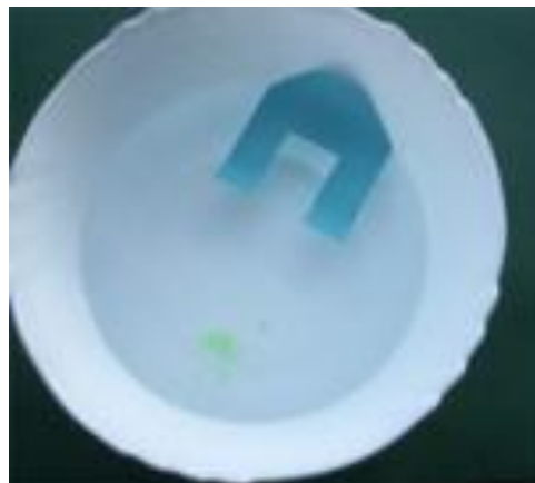
Das Boot wird "angetrieben"