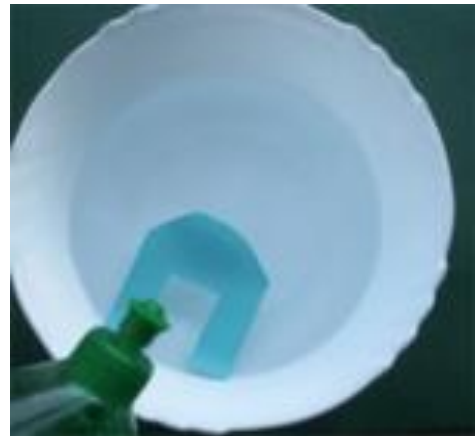
Der Tropfen Spülmittel kommt dazu